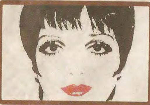
“ LIZA MINNELLI

E' diventata l'icona warholiana più celebre. Ma tra i suoi ritratti ci sono anche Mao, Che Guevara e John Wayne