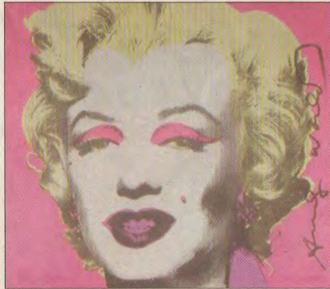
La Marilyn di Warhol

Saranno esposte inoltre opere che spaziano dal 1967 con la "Banana" dei Velvet Underground, all'opera dedicata al concerto live di Liza Minnelli alla Carnegie All di New York; da "Sticky Finger" a "Love you live" dei Rolling Stones; sino a cover meno conosciute come quella dedicata a Loredana Bertè del disco made in Italy del 1981 con la foto scattata de Christofer Makos.