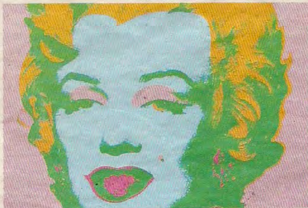
Marilyn Monroe “vista e ritoccata” da Andy Warhol

RICCIONE Se Modigliani ha saputo esprimere appieno l'estetica del ventesimo secolo, Andy Warhol, l'artista delle star, di cui Marilyn Monroe è il soggetto più famoso, è ritrattista insuperato. Le celebrazioni del 40ennio dalla scomparsa della “Meravigliosa Marilyn” contribuiranno forse a equilibrare la conoscenza del personaggio al di sopra dell'icona creata da Warhol: proprio questo è l'intento della mostra “Andy Warhol: Marilyn e la Musica”, che sarà inaugurata oggi alle ore 19 al Palazzo del Turismo, e aperta fino al 26 agosto. Si potranno ammirare tutte le opere della serie dedicata da Warhol a Marilyn Monroe provenienti dalla Collezione Rosini Gutman, nonché la raccolta completa delle “Cover” dei dischi 33 giri eseguite dall'artista: da “Banana” dei Velvet Underground a “Love You Live” dei Rolling Stones. Il percorso sarà completato dall'esposizione dei ritratti originali utilizzati per le cover, come quelli di Liza Minnelli o Mick Jagger, per un totale di 70 tra pezzi unici, memorabilia e grafiche. (g.c.)